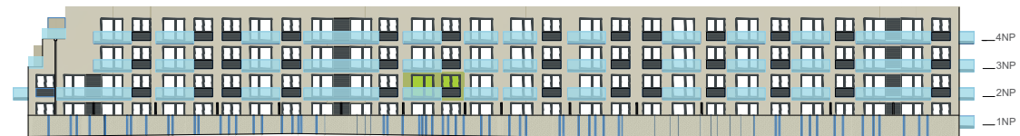
Jižní pohled na dům / Building View - south side