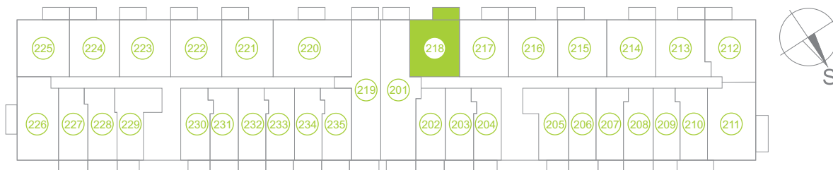
Půdorys podlaží / Floor plan